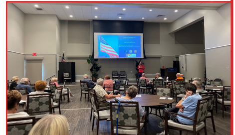
¡Fue un placer hablar con los residentes de Si-ena Lakes Senior Living Community sobre las próximas elecciones!